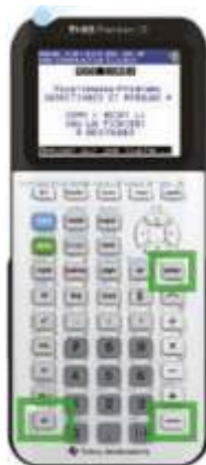
TI 83 CE