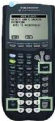
TI 82 Advanced