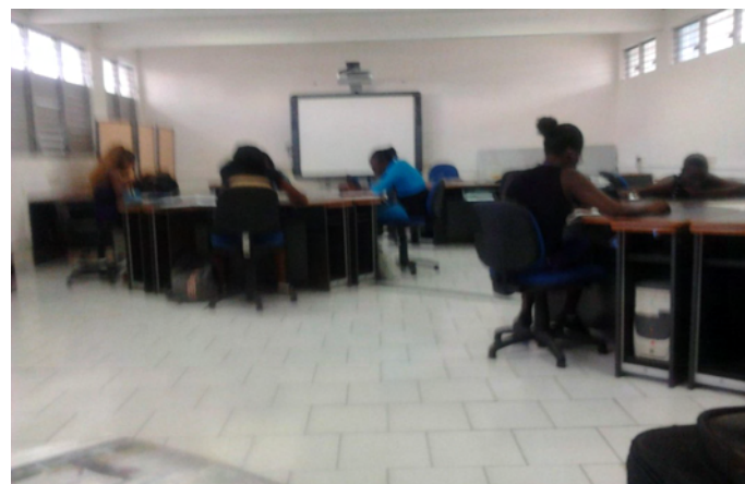
« Groupe de pilotage Economie et Gestion en lp »

Bonjour Monsieur, voilà mon dossier pour une période de formation en entreprise en Bac Pro Gestion - Administration